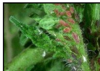
Păduchi de frunză

Pentru combaterea agenților de dăunare, se recomandă utilizarea uneia dintre variantele cu produse de protecție a plantelor: