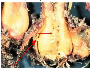
Atac de larve